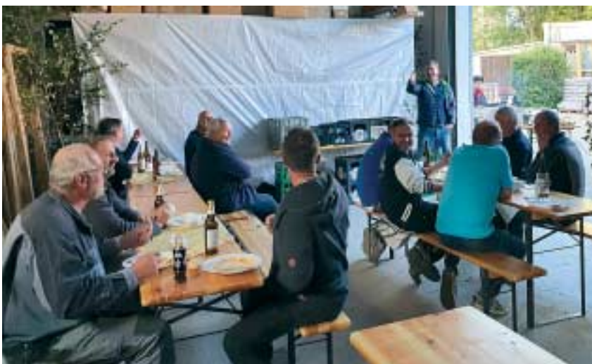
Ein Zeichen der Dankbarkeit für sieben Jahre gemeinsames Streben an unsere Handwerker war mehr als gerechtfertigt und den kleinen Aufwand wert.

Wir wünschen ganz viel Glück und Wohlergehen, wirtschaftlichen Erfolg und uns selber weiterhin gute Preise! - Nochmals Danke!