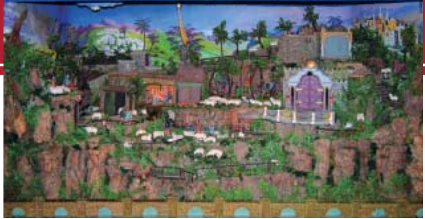
Der berühmte Weihnachtsberg der Familie Kobel in Brünlos, den man gern besichtigen kann, ist ein Zeugnis, dass die Erzgebirger gern die heilige Geschichte in ihre eigene Umwelt transferieren.

Unsauberkeit, Nichtstun, Faul- und Pflichtvergessenheit oft drakonisch, mitunter brutal zu bestrafen.