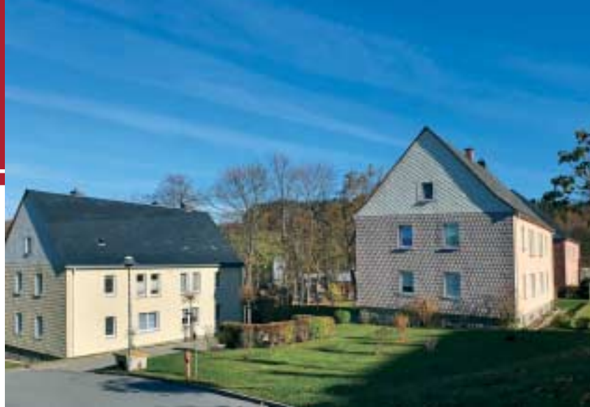
Im Bild die Häuser Rutenweg 50, 46 und 48, wo 2021 wie bei Nr. 39 Balkone angebaut werden.

Nachdem die Genossenschaft in den Häusern Bahnhof-, Goethe- und Breite Straße seit 2013 158 Balkone angebaut hat, soll es nun auch auf dem Rutenweg ab 2021 vorangehen. Geplant ist, mit den Häusern 39, 46, 48 und 50 zu beginnen, die mit ihrer straßennahen Lage so ein kleines Extra durchaus verdienen. Selbstverständlich soll es in den folgenden Jahren weitergehen, wenngleich bei der Anzahl von 84 Wohnungen und der hohen Kosten hier sicher ein paar Jahre vonnöten sein werden.