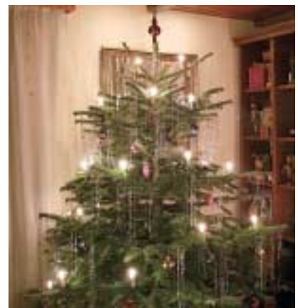
Ein recht traditionell geschmückter Christbaum, so mit Glaskugeln, Figuren und viel Lametta.

Grund genug also, sich der alten sinnstiftenden Bräuche und Bezüge zu erinnern, vor allem sie von modischem Schnickschnack sauber zu halten und durch praktische Anwendung der nächsten Generationen weiterzugeben.