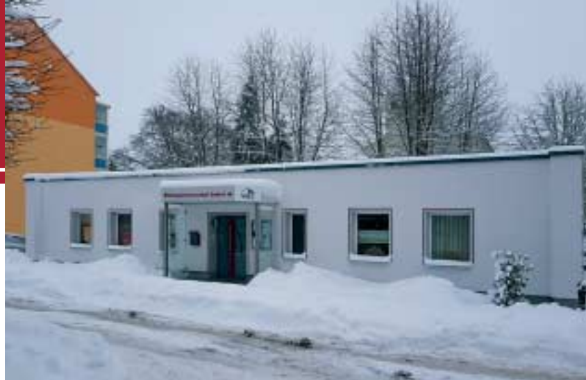
Unsere Geschäftsstelle Neue Straße 5a in Zwönitz zur Weihnachtszeit Januar 2020.