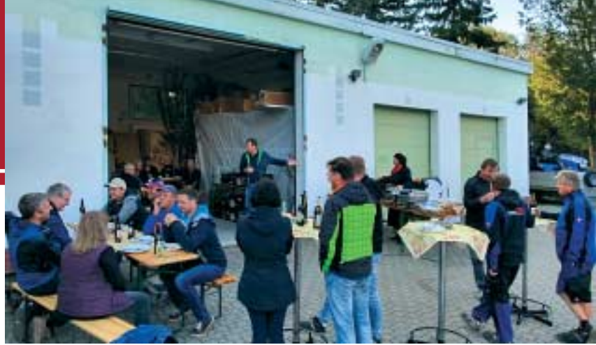
Am 17. September hatte der Vorstand die Firmen in den Wirtschaftshof der Genossenschaft geladen.

Bis heute hat es sich als ein großes Glück erwiesen, dass die Ausschreibungen von heimischen Firmen gewonnen wurden, im echten Wortsinn auf der Baustelle die gleiche Sprache gesprochen wird. Denn eine gute Verständigung und ein wenig Gemeinschaftsgefühl hilft