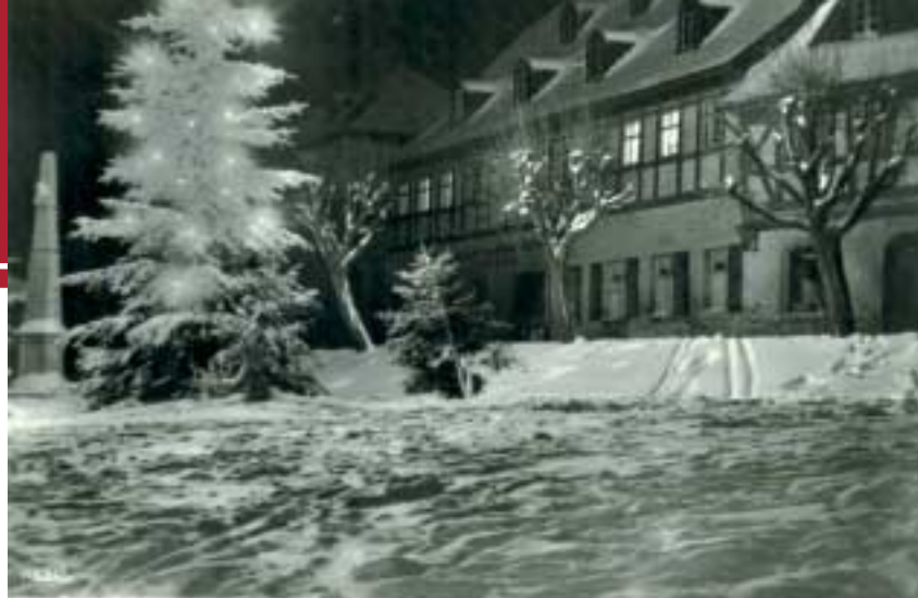
Der weihnachtlich geschmückte Markt um 1955 auf einer alten Postkarte der Gebrüder Stelzel.

nachtszeit normalerweise recht stressig und überladen. Wollen wir also die Chance ergreifen, mehr Gelassenheit und vor allem Besinnlichkeit zuzulassen. Erinnern wir uns an frühere Zeiten, wo Weihnachten noch nicht so vollständig mit kommerziellem Tand überladen war, amerikanische Walt-Disney-Figuren aus jeder Ecke lugten und die Menschen zu infantilen - in kindlicher Einfalt stecken gebliebenen und geistig unterentwickelten - Objekten degradierten. Nein, der Weihnachtsmann ist keine Erfindung der Cocka-Cola-Werbung, wie man derzeit wieder überall unterbreitet bekommt und seine Aufgabe war nie zuerst, den Kindern billiges Plastikspielzeug säckeweise in die Kinderzimmer zu schütten. Der richtige Weihnachtsmann, oder Knecht Ruprecht, wie man hier im Erzgebirge sagt, war ein recht zwiespältiger Gesell. Geschenke gab es nur für den, der übers Jahr seine Pflichten ordnungsgemäß erledigt hatte. Allen anderen drohte ein Strafgericht! Da tut es recht gut, wenn man in all der Informationsflut mal ein paar Zeilen zu den historischen und kulturellen Hintergründen unseres „Weihnachtskultes“ liest. So gesche-